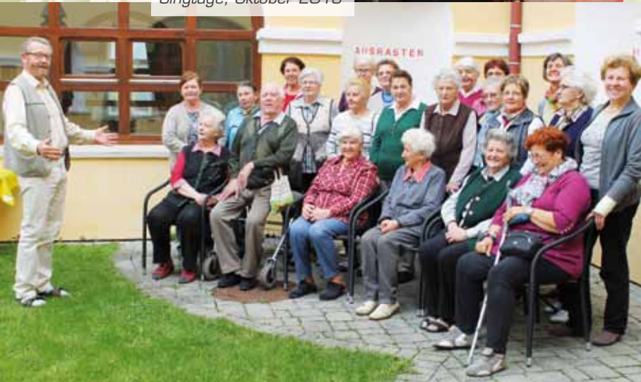
Singtage, Oktober 2013

„Ich habe mich sehr wohl gefühlt – das Haus hat sehr viel Herzenswärme.“