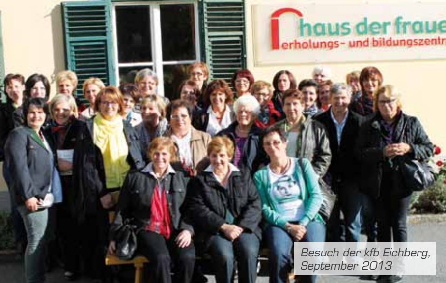
Besuch der kfb Eichberg, September 2013