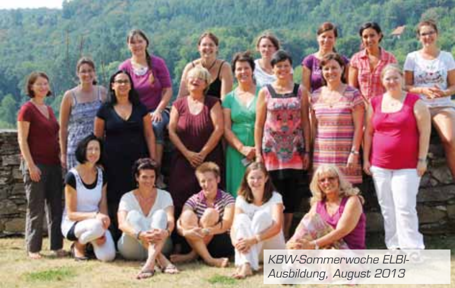
KBW-Sommerwoche ELBI-Ausbildung, August 2013