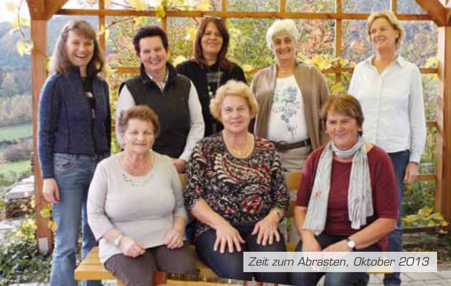
Zeit zum Abrasten, Oktober 2013