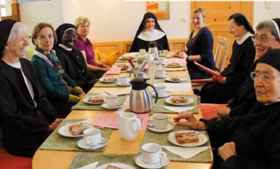
Geburtstagskaffee mit den Benediktinerinnen, September 2013

„Alle in diesem Haus Beschäftigten haben sehr dazu beigetragen, dass es für uns Wohlfühltag waren.“