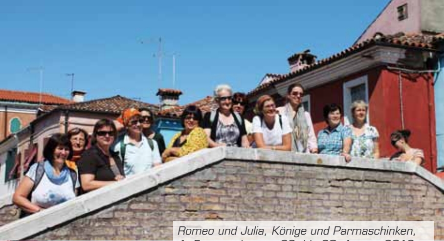
Romeo und Julia, Könige und Parmaschinken, 1. Frauenreise von 26. bis 30. August 2013