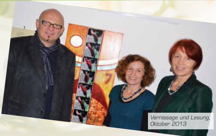
Vernissage und Lesung, Oktober 2013