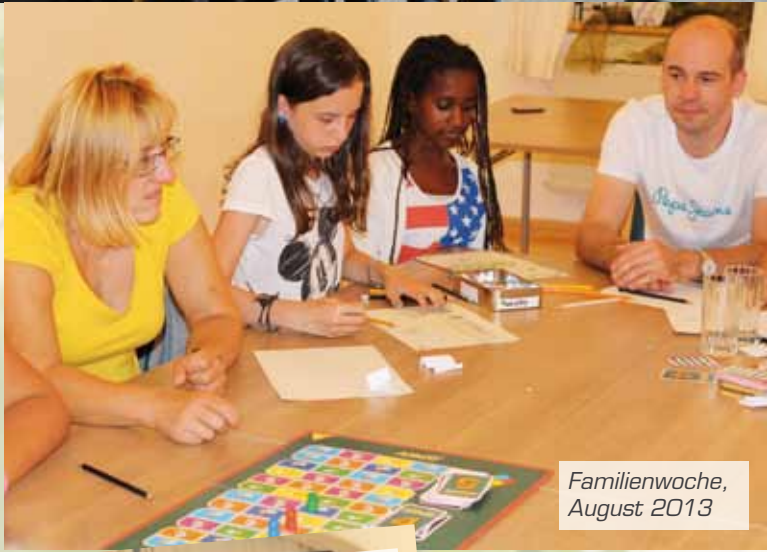
Familienwoche, August 2013