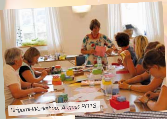
Origami-Workshop, August 2013