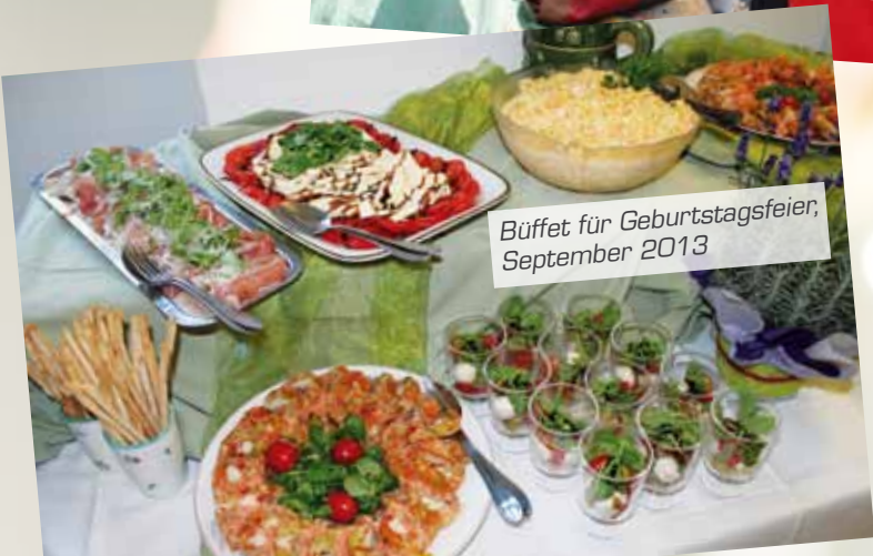
Büffet für Geburtstagsfeier, September 2013