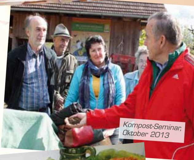
Kompost-Seminar, Oktober 2013

„Es ist eine Wohltat, im Haus der Frauen für Körper, Geist, und Seele sein zu dürfen.“