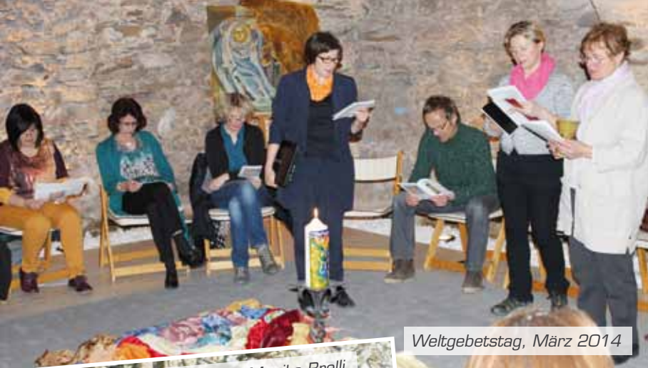
Weltgebetstag, März 2014