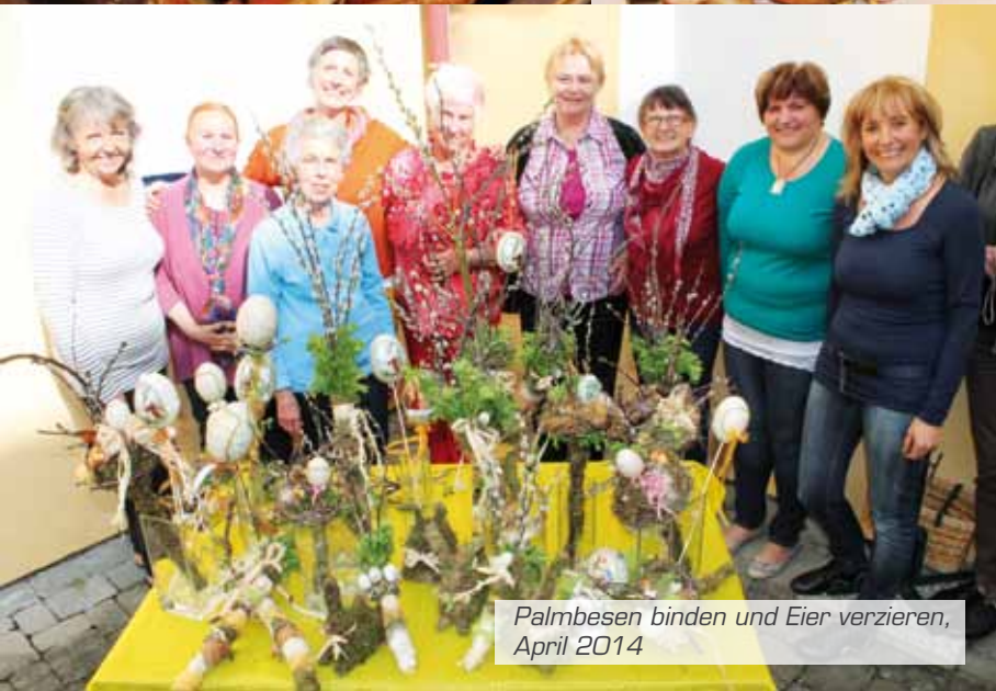
Palmbesen binden und Eier verzieren, April 2014