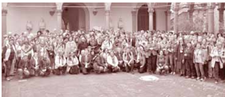
Impressionen von der Studienreise der kfb Österreich auf den „Spuren der Hl. Katharina von Siena“ im Oktober 2013

Gemeinschaft erleben, austauschen, neue Impulse bekommen und gestärkt werden, so sind die Bildungstage zu einer herzlichen, fröhlichen, spirituellen Erfahrung geworden.