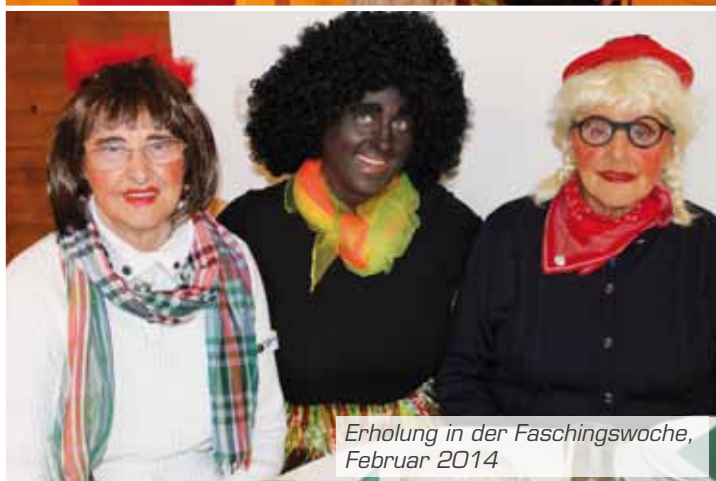
Erholung in der Faschingswoche, Februar 2014