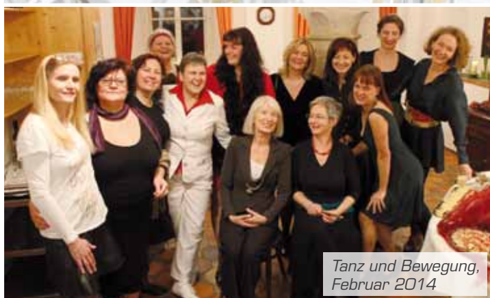
Tanz und Bewegung, Februar 2014