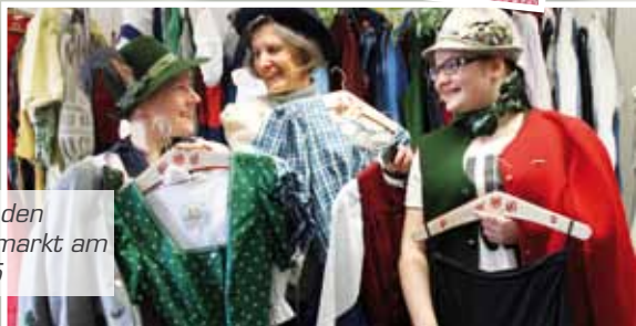
Posieren für den Trachtenflohmarkt am 9. Mai 2015

Das Haus der Frauen ist ein Haus der Freude!