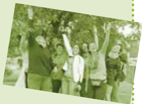
Bild weiblicher Spiritualität. Tauchen Sie mit uns in diese spannende Nacht ein!

Ein buntes Mosaik verschiedenster Workshops zeichnet ein farbenfrohes