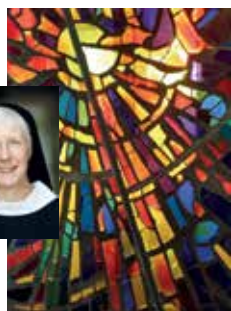
„Sonnenster“ von Sr. Basilia Gürth OSB, im Kloster St. Gabriel