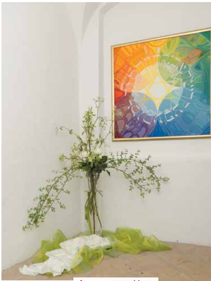
Aus unserem Haus

Das Haus-der-Frauen-Programm auf einen Blick – zum Herausnehmen