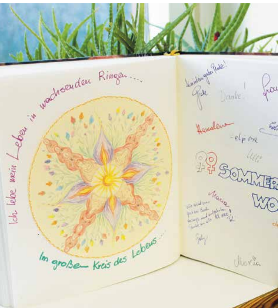
Auszug aus unserem Gästebuch: Eintrag einer Gastgruppe