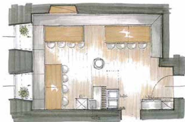
Plan Beleuchtungskonzept: Firma Schuh

Lange haben wir dieses Ziel verfolgt, am 3. Dezember war es endlich soweit: Die Renovierung unseres Speisesaales wurde begonnen und soll bis Anfang Februar abgeschlossen sein. Erneuerungen betreffen den Fußboden, die komplette Einrichtung, eine Fußbodenheizung und ein umfassendes Beleuchtungskonzept. Ziele waren eine Verbesserung der Akustik, eine optimale Raumnutzung und der Wunsch, die Atmosphäre des Hauses auch im Speisesaal aufleben zu lassen spürbarer zu machen. Lassen Sie sich von unserer Buffettlösung überraschen! Seien Sie neugierig – besuchen Sie eine unserer Veranstaltungen oder kommen Sie als Gast und genießen Sie unsere ausgezeichnete Küche in einem neuen, einladenden, wohltuenden Ambiente!