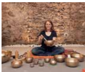
Haus der Frauen

Gong, Klangschalen, Monochord, Trommel und andere obertonreiche Instrumente laden Sie ein auf einen entspannenden Abend. Der berührende Klang, die wachsende Ruhe, besinnliche Texte und heilsame Stille geleiten Sie hinein zu einer erwartungs- und verheißungsvollen Adventzeit.