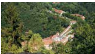
Haus der Frauen

Unter dem Motto „größte Vielfalt auf kleinstem Raum“ erwandern wir an diesem Tag 5 Schlösser, Burgen und Ruinen – alle im ApfelLand gelegen, das sich im Herbst von einer besonders schönen Seite zeigt. Auf Schloss Herberstein werfen wir vom „Kranzerl“ aus einen Blick von oben, danach liegen Burg Neuhaus, Schloss Stubenberg, die Ruine Alt-Schielleiten und das Schloss Schielleiten auf unserem Weg. Wir treffen uns um 8.30 Uhr im Haus der Frauen, um 9.00 Uhr starten wir unsere Schlössertour. Um 18.00 Uhr erwartet uns im Haus der Frauen ein köstliches gemeinsames Abendessen.