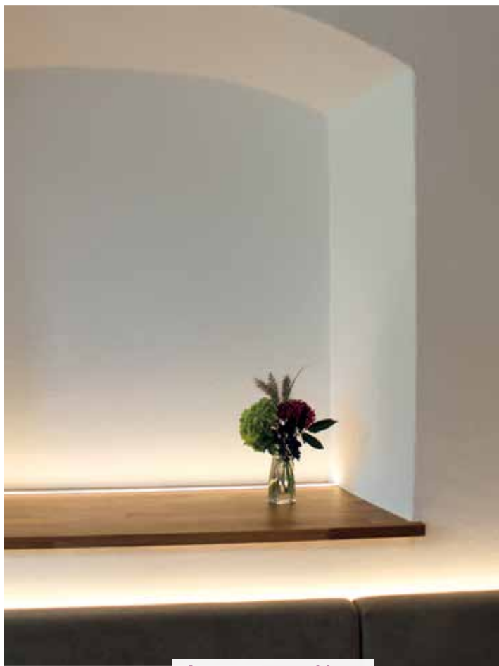
Aus unserem Haus

Das Haus-der-Frauen-Programm auf einen Blick – zum Herausnehmen