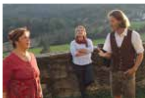
Haus der Frauen

Jodeln reicht tief in die Seele. Wir wenden uns dieser urtümlichen Gesangsform in seinen vielen Facetten und Stimmungen zu – von verspielt-lustig bis breit und in sich ruhend. Nach einer gemütlichen Kaffee-/Teejause lassen wir unsere Jodler noch einmal in der stimmungsvollen Kirche von St. Johann erklingen. NeueinsteigerInnen wie auch bereits „Jodeler-probte“ werden ihre Freude haben.