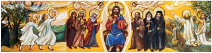
dreiteiliges Holztafelbild von Sr. Basilia Gürth OSB in der Klosterkapelle

„Auch wer sonst still für sich beten will, trete einfach ein und bete, nicht mit lauter Stimme, sondern mit wacher Aufmerksamkeit des Herzens.“